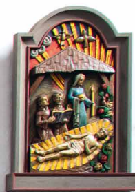
Kath. Pfarrkirche St. Nikolaus Kloster Rumbeck in Arnberg- Rumbeck